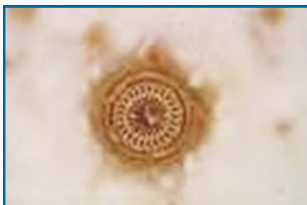
เห็บระฆัง

เห็บระฆังอาการ : ปลาไม่ค่อยกินอาหาร พลิกตัวไปมาว่ายน้ำทุรนทุรายและใช้ลำตัวสีผนังบ่อเพื่อให้ปรสิตหลุดออก