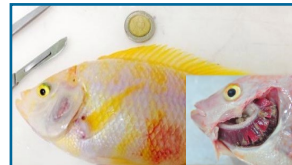
โรคเหงือกเน่าในปลานิล

อาการ : ปลาไม่กินอาหาร ว่ายน้ำเฉื่อยชา ครีบคร่อน ตกเลือด เกิดบาดแผลเป็นหลุม ท้องบวม