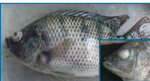
โรคติดเชื้อสเตรปโตคอคคัส

อาการ : ภายนอกของปลาที่ติดเชื้อแบคทีเรีย ปลาโหวแบคทีเรียมีลักษณะตัวต่าง เหงือกเน่า ดูลำไส้กับมีเศษตะกอนดินโคลนติดอยู่